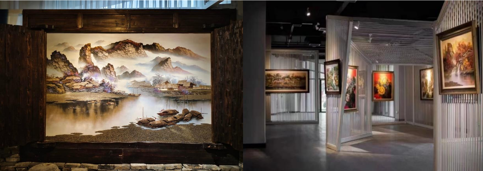
เลื่องลือไปทั่วโลก

กว่าพันปี และเลือกซื้อสมุนไพรจีน ชมผลงานจิตรกรรมที่สวยงามจนได้รับรางวัลมากมายที่ พิพิธภัณฑ์ภาพวาด ทราย "จวินเซิงอว่าเฮียน" พิพิธภัณฑ์ที่จัดแสดงภาพวาดของหิ้งจวินเซิง ซึ่งเป็นผู้ที่ริเริ่ม ศิลปะแบบใหม่ ที่เรียกกันว่า จิตรกรรม ภาพเม็ดทราย ที่ใช้วัสดุธรรมชาติ เช่นกรวดสี เม็ดทราย กิ่งไม้ หิน มาจัดแต่งเป็นภาพทิวทัศน์ เป็นที่